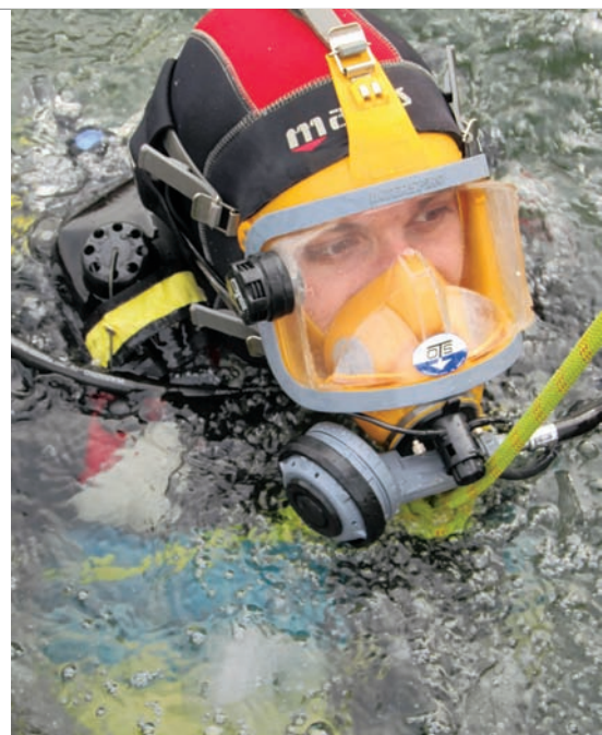
Најбоља посада Речне флотиле